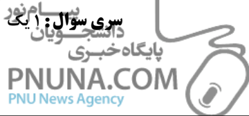
ادامه جدول ۱ الف

رشته تحصیلی/کد درس: مهندسی صنایع، مهندسی صنایع (چندبخشی) ۱۳۱۸۱۰۷